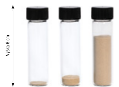
Úroveň kontaminace u různých filtrů vyrobených dle ISO 4406 se může dramaticky lišit

*Odvodeno na základě standardizovaného testu dle ISO 16889 s automatickým počítadlem nečistot certifikovaným NIST a středními testovacími nečistotami dle ISO. (za předpokladu sférického tvaru nečistot a nižšího průměru testovacích nečistot). Skutečně naměřené nečistoty se mohou lišit.